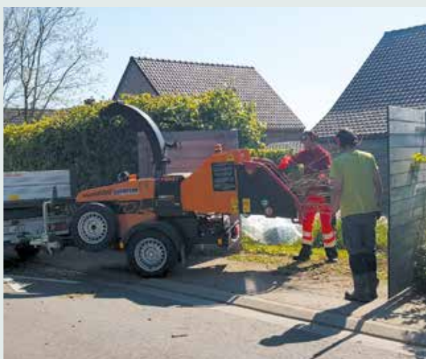
Broyage à domicile des branchages