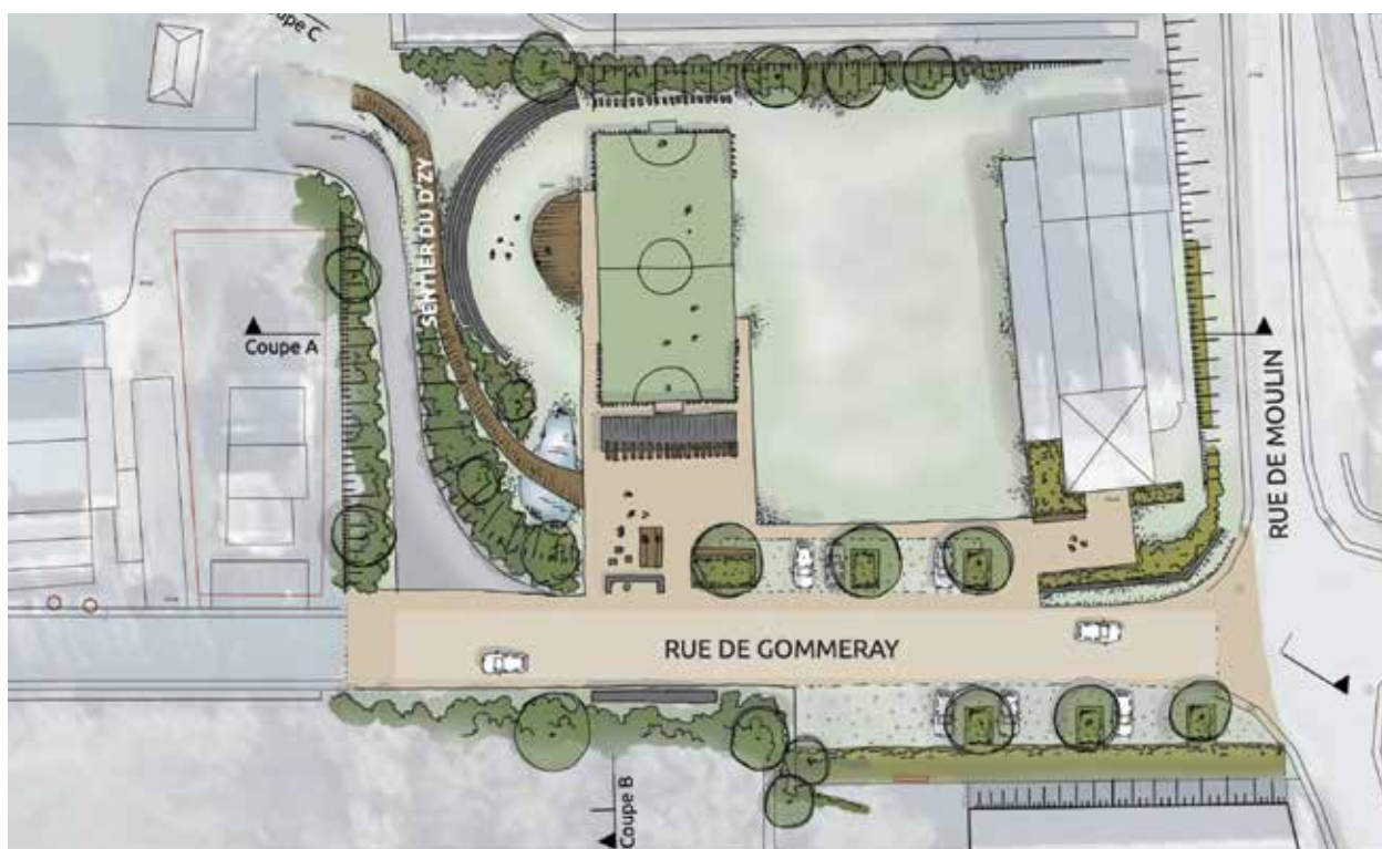
Dominique Albanese, Échevin des sports