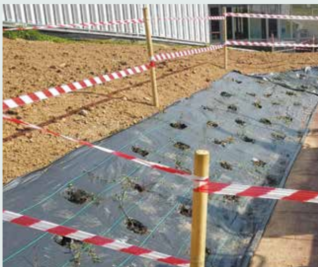
Ecole communale : aménagement des abords du nouveau module de jeu