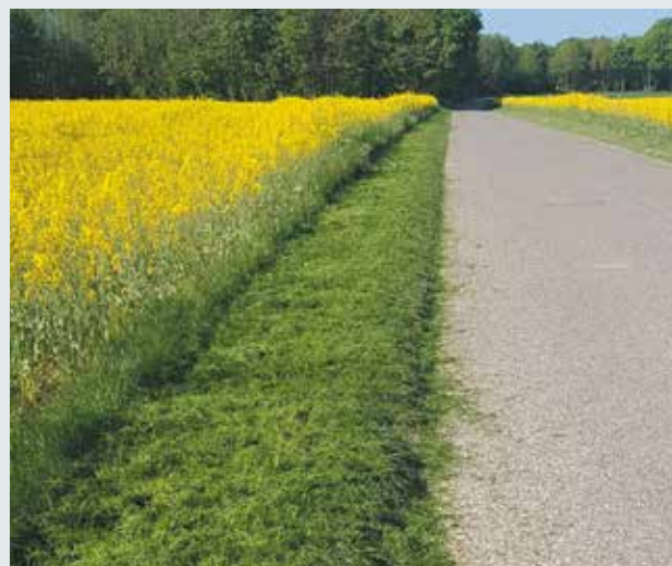
Fauchage des accotements