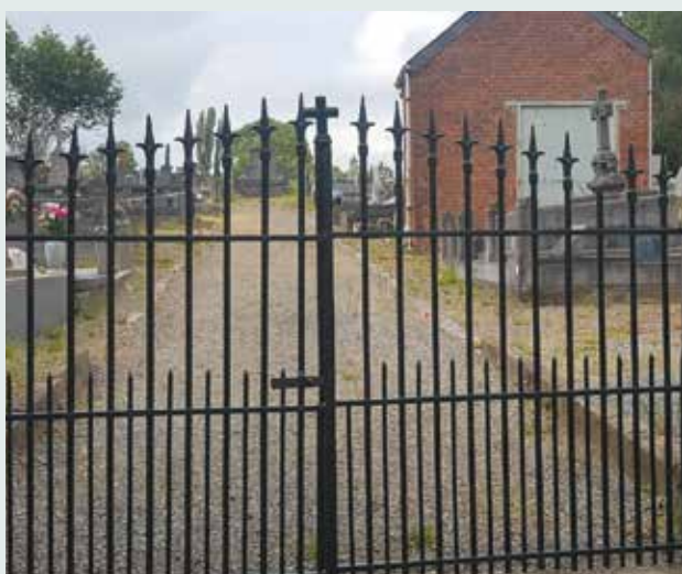
Restauration des grilles des cimetières