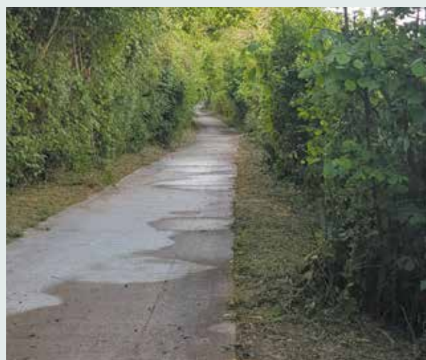
Entretien des chemins et sentiers