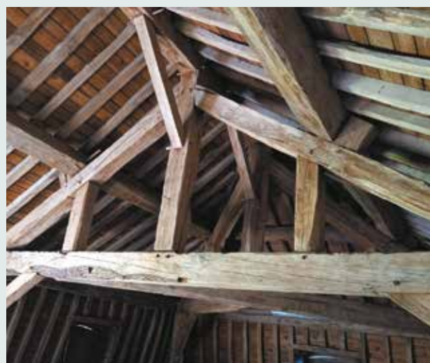
Traitement des poutres du bâtiment du camping de Fraiture